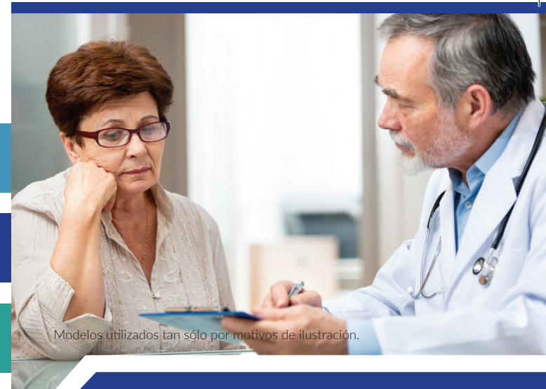
Modelos utilizados tan sólo por motivos de ilustración.